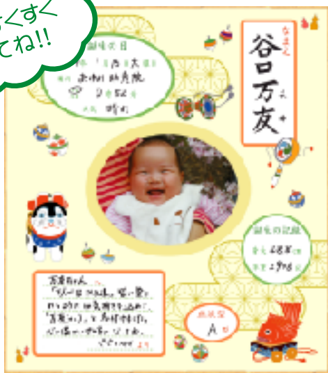
S165-3 お誕生の記録 使用例