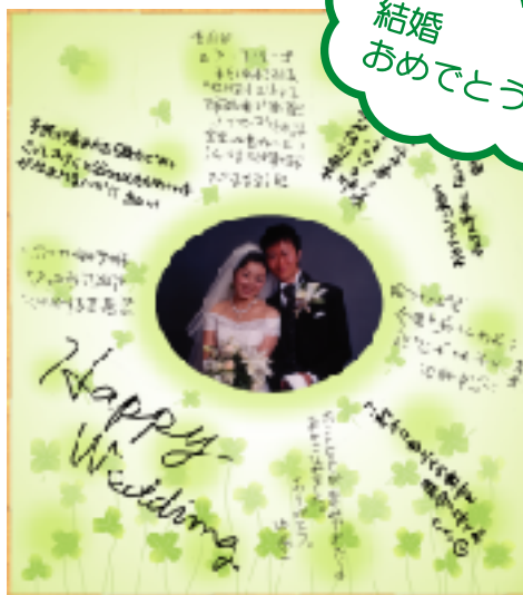
S165-4 クローバー 使用例