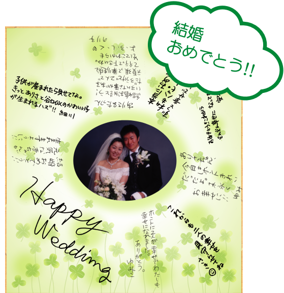
S165-4 クローバー 使用例