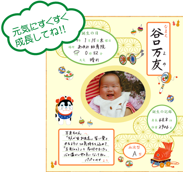
S165-3 お誕生の記録 使用例