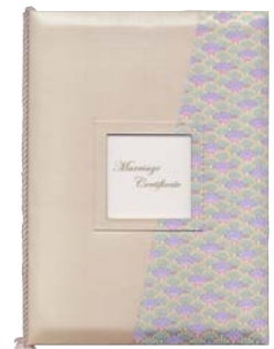
WSM20-001 彩華 さいか

他、「花舞・宝寿・瑞祥」デザインを取り揃えています。 詳しくは【総合カタログ】をご参照ください。