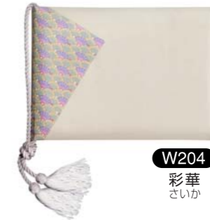
W204 彩華 さいか