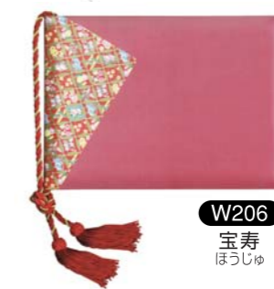
W206 宝寿 ほうじゆ