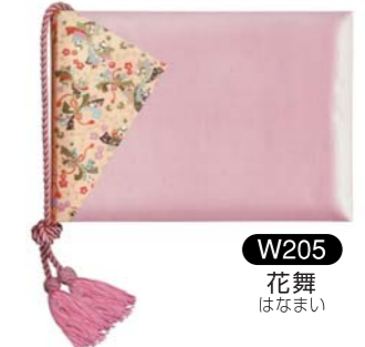
W205 花舞 はなまい