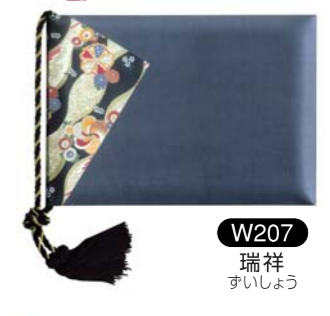
W207 瑞祥 ずいしょう