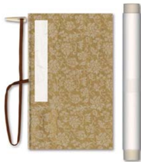
品番：KT152 唐草 黄金 4532742066953