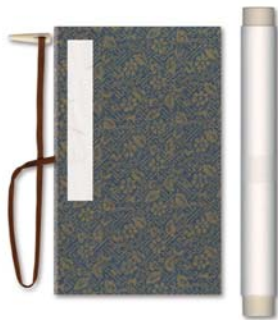
品番：KT150 紗綾形 濃藍 4532742066939