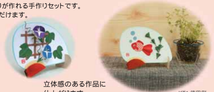
立体感のある作品に仕上がります。