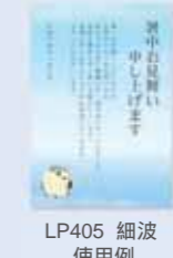
LP405 細波 使用例